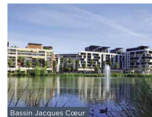
Bassin Jacques Cœur