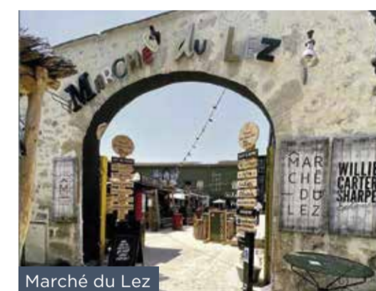
Marché du Lez