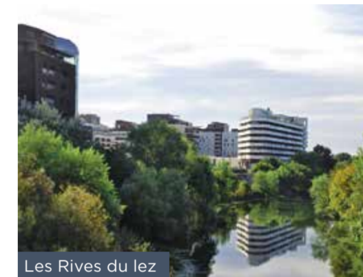
Les Rives du lez