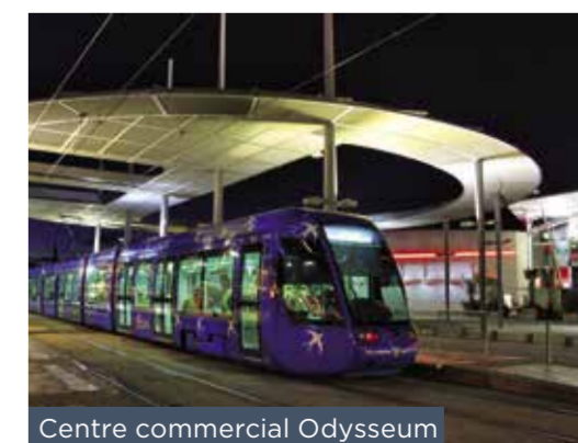
Centre commercial Odysseum