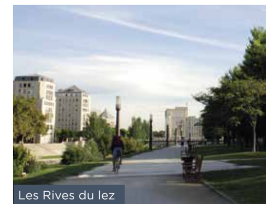
Les Rives du lez